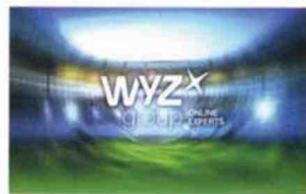
À l'occasion de son anniversaire, Wyz a dévoilé sa nouvelle image de marque.